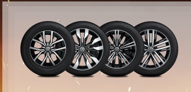
Колеса и диски